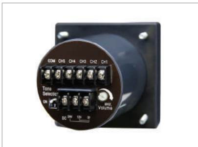
전원 및 음색 결선용 단자대(후면)