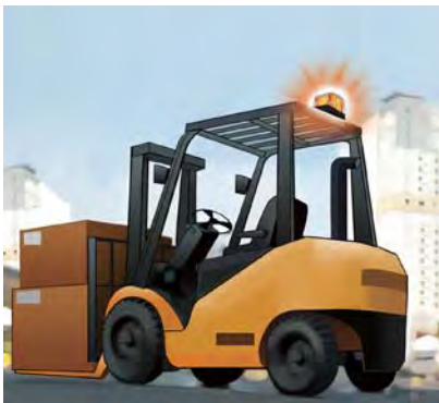
지게차에 적용된 SKTL 모델