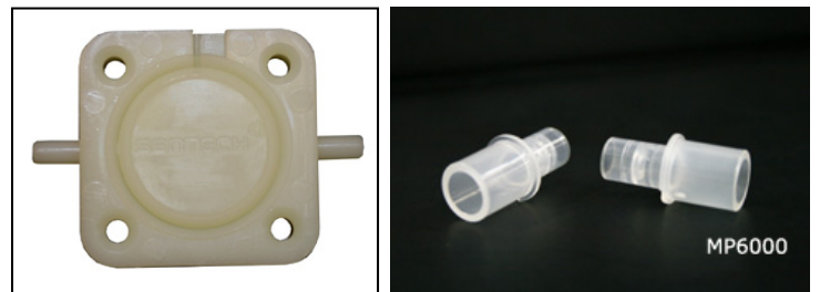
전기화학식 센서(Fuel Cell Sensor)